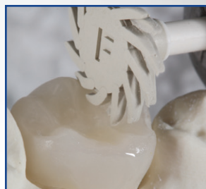
POLISSOIR UNIVERSEL ÉTAPE 2

Prépolissage de restaurations en zircone, disilicate de lithium ou porcelaine/matériaux céramométalliques