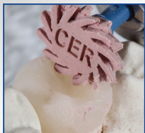
POLISSOIR UNIVERSEL CÉRAMIQUE, ÉTAPE 1

Prépolissage de restaurations en zircone, disilicate de lithium ou porcelaine/matériaux céramométalliques