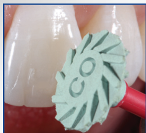
POLISSOIR UNIVERSEL COMPOSITE, ÉTAPE 1

Prépolissage des restaurations composites