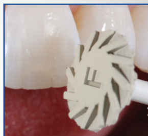
POLISSOIR UNIVERSEL ÉTAPE 2

Prépolissage des restaurations composites